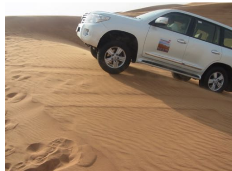
Wüstenfahrt mit modernen Kamelen dieser Zeit