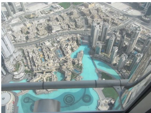
Burj Khalifa: Blick v. höchsten Gebäude der Welt (828 m)