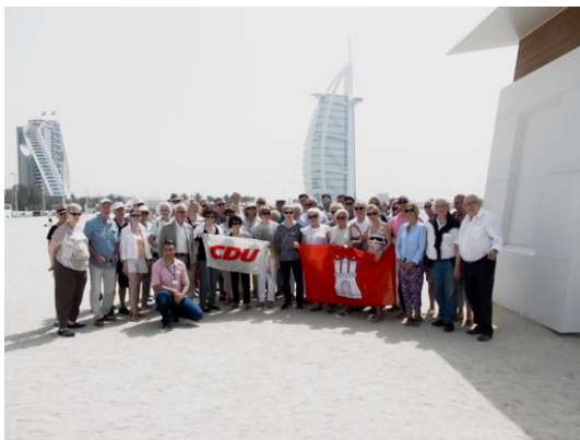
Dubai: vor dem Burj al Arab

Freitag, den 28. April bis Mittwoch, den 03. Mai 2017, Fernreise nach Dubai im Rahmen der Mitgliederbetreuung mit 54 Teilnehmerinnen und Teilnehmer ausgebucht