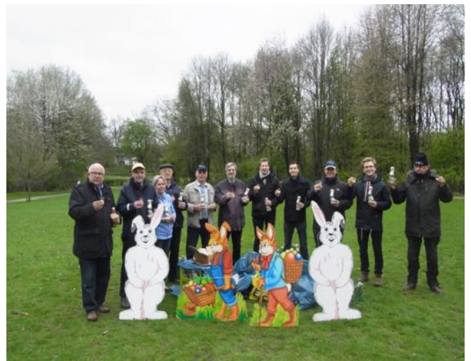
Das 44. Ostereiersammeln wurde mit einem Eierlikör nach Verteilung begossen.