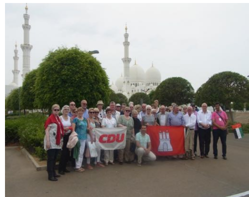
Abu Dhabi: vor der Scheich-Zayid-Moschee