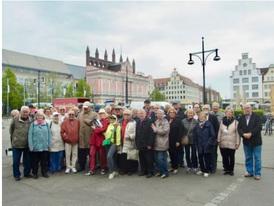
„Fröhliches Beisammensein“ vor dem Rostocker Rathaus