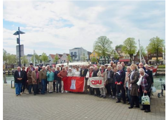
Auch in Warnemünde hat es uns wieder sehr gut gefallen